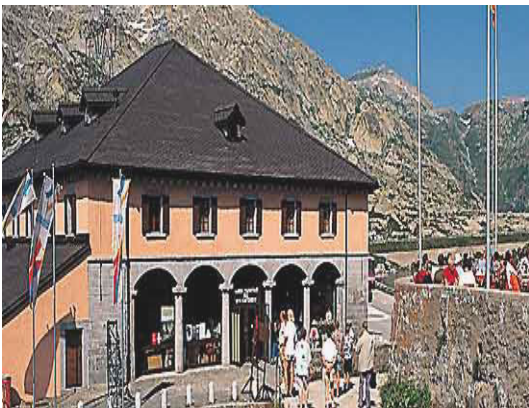
Museum San Gottardo